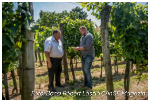
Fotó: Bácsi Róbert László/VinCE Magazin

19. alkalommal rendezték meg a VinAgora Nemzetközi Borversenyt, ahol a NAIK Szőlészeti és Borászati Kutatóintézet először mérettette meg magát. Hazánk